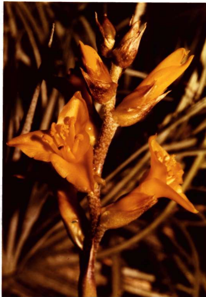
DYCKIA choristaminea MEZ, 1919 Interessante, kleinbleibende Art ans den Trockengebieten Brasiliens

Bei neuen Gewächshäusern sollte man heute nur noch Doppelglas oder Doppelstegplatten verwenden. Beide Produkte sparen ca. 40% Energie ein. Die hohen Anschaffungskosten machen sich bei den heutigen Energiepreisen schnell bezahlt. Auch ältere Gewächshäuser lassen sich noch mit Doppelstegplatten aus Plexiglas umrüsten.