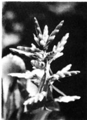
Zu unserem letzten Titelbild: Aechmea tessmannii HARMS

Unter dem Titel „Buch und Spaten“ erschien bei der Gärtnerschen Fachbuchhandlung Dr. Rudolf Georgi, Theaterstraße 77, 5100 Aachen ein Fachbuchverzeichnis mit einer großen Auswahl von botanischen Büchern.